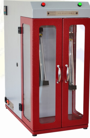
TÜP ÇALKALAYICI - Y13