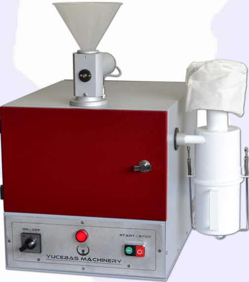
ÇEKİÇLİ DEĞİRMEN - Y17