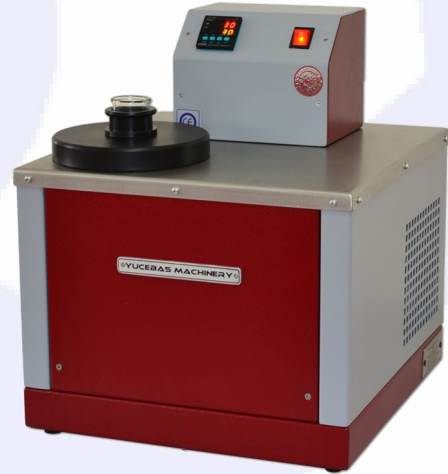
ISITMALI SOĞUTMALI SU TANKI - Y14