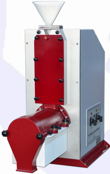
KOMBİNE DEĞİRMEN - Y16