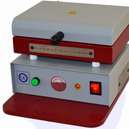
GLUTEN KURUTUCU - Y09