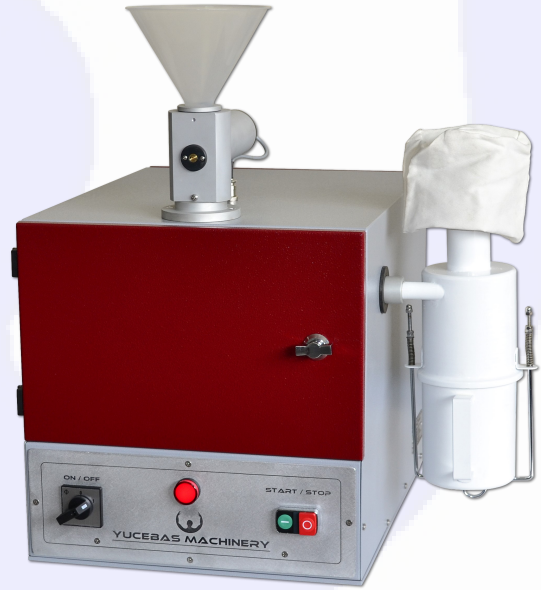
ÇEKİÇLİ DEĞİRMEN - Y17