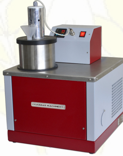
ISITMALI SOĞUTMALI SU TANKI - Y14.3

Gluten Set İle Birlikte Tavsiye Edilen Cihazlar