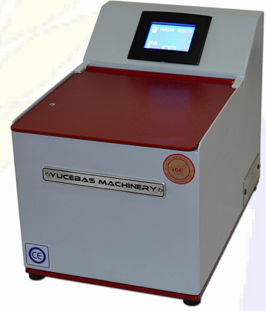
GLUTEN INDEX CİHAZI - Y08