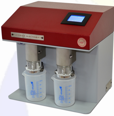
GLUTEN YIKAMA CİHAZI - Y07

Toplamda 10 dk.'dan kısa bir sürede tüm sonuçlar elde edilir.